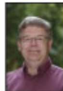
Pierre Corbeil, Ministre des Ressources naturelles et de la Faune